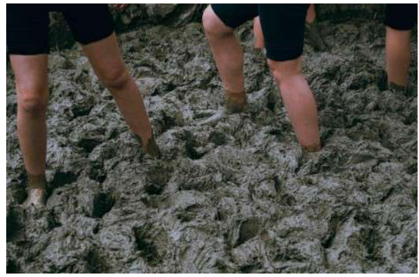
Les pieds dans la boue thermique de Dax pour préparer le mélange sur la structure métallique.