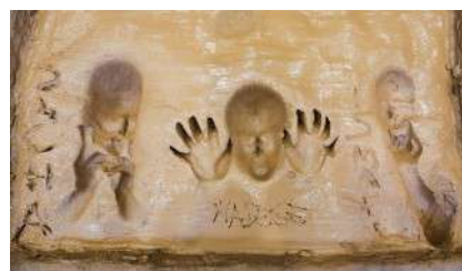
Une petite signature pour se rappeler où on a laissé empreinte. Isabelle Louvier / SO