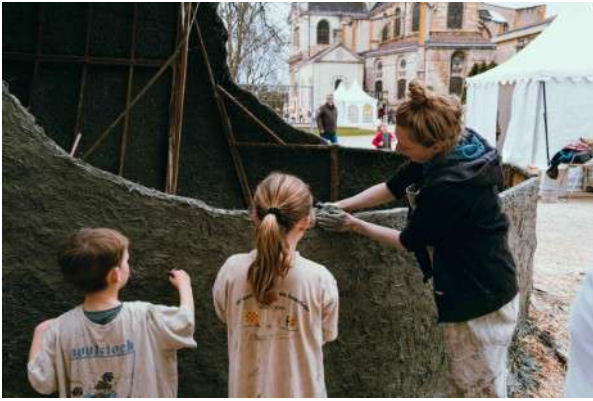
Des enfants accompagnés par une artiste appliquent le torchis appliqué à la tête géante. Amaury Dollez