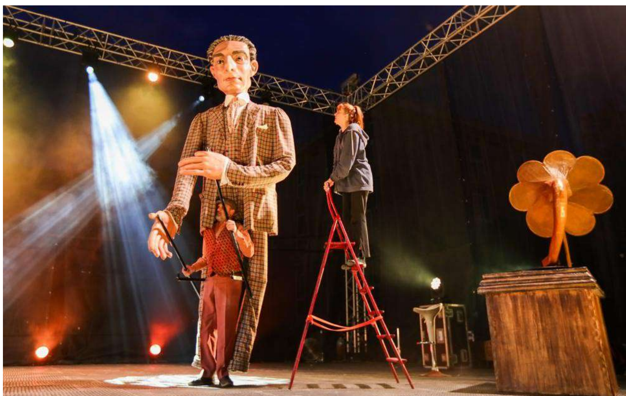
Les géants montent sur scène pour l'ouverture du festival, vendredi soir, sous la baguette du géant Maurice Ravel sur une mise en scène de la Cie Kilika.

Après un lancement bien au sec vendredi 21 mars au soir, la parade des géants de samedi a dû être annulée à cause des intempéries. Une solution de rechange a néanmoins été mise en place sous le carreau des halles, dans une ambiance festive