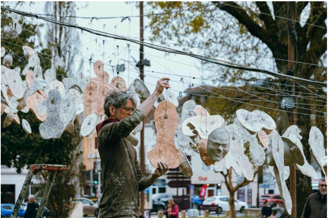
Les moulages de visages dacquois volontaires sont accrochés dans le parc devant la mairie. Amaury Dollez

À Dax, les masques tomberont dans l'après-midi de clôture du festival. Et les habitants qui avaient donné leur visage pour un moulage, aujourd'hui exposé dans le parc, seront invités à venir récupérer leur autre identité.