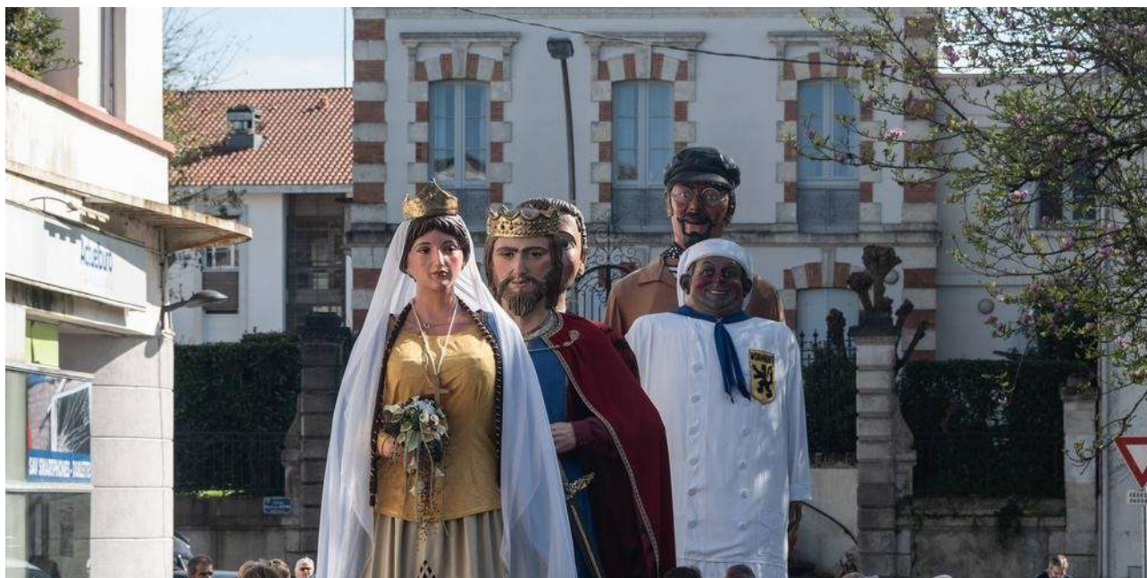
Le festival Têtes en l'air fait son retour à Dax du 21 au 23 mars 2025.