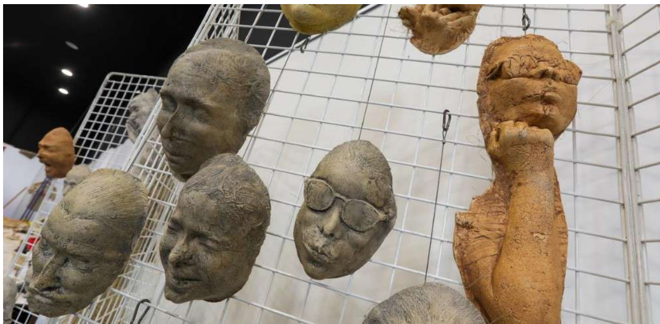
Certains ont fait le choix de conserver leurs lunettes.

Ces 300 visages moulés au cours de ces ateliers serviront lors de la seconde édition du festival Têtes en l'air (du 21 au 23 mars 2025). En amont, une tête géante de 6 mètres de hauteur sera construite en boue thermale par les Dacquois (du 15 au 22 mars, dans le square Max-Moras). Un projet participatif intitulé « L'Odyssée ». « Les habitants sont moteurs de ce projet. Ils se rencontrent et se fédèrent autour de celui-ci », détaille David Robichon, membre de la compagnie depuis le milieu des années 2000.